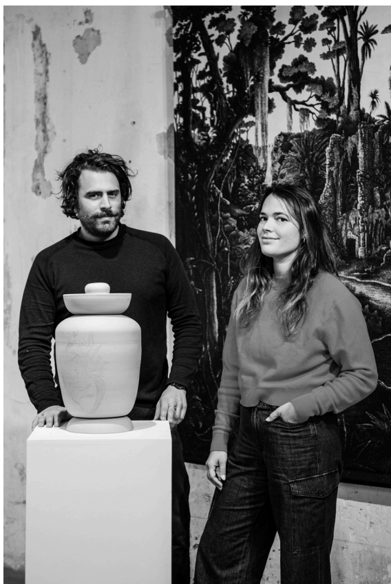
Collaboration à l'exposition des finalistes du prix d'art contemporain Don Papa.