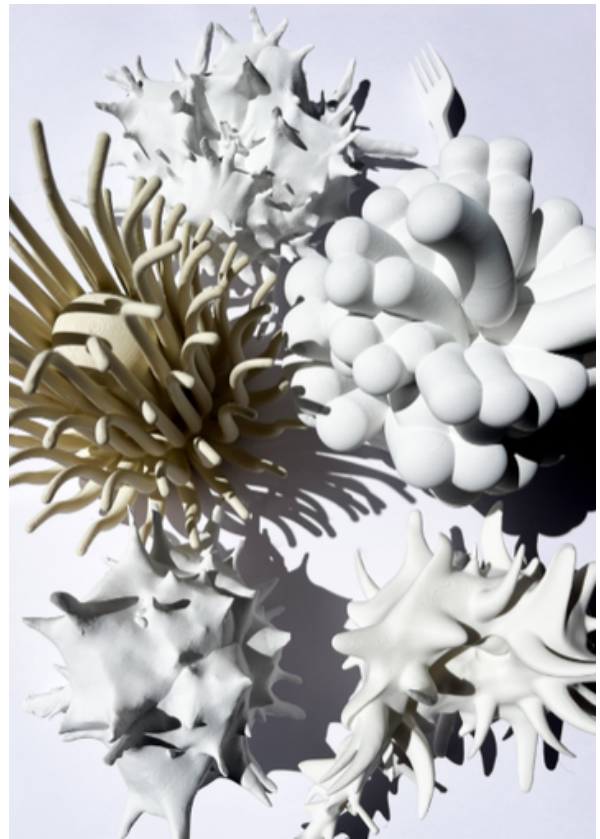
Sculpture, Lionel Dinis Salazar, 2026

« Nous invitons les visiteurs dans nos imaginaires, empreints de mystère et de fantasme. La science s'y entremêle au merveilleux pour éveiller les sens, invitant à une contemplation active, à une évasion hors du monde et du temps. »