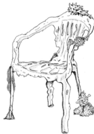
Dessin numérique, Lionel Dinis Salazar, 2026.

Les coquilles se nourrissent de polymères et fusionnent avec eux, intensifiant l'éclat de leur nacre.