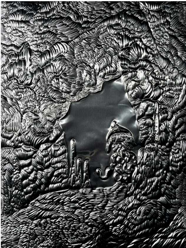
Crypta , dessin sur aluminium, Manon Diemer, 2026

Naviguant entre archive scientifique et mise en scène phénoménologique, l'exposition Les Larmes de Sirène sonde notre capacité à esthétiser la dystopie. L'exposition génère une zone d'éco-anxiété sourde où la beauté fascinante, devenue indissociable de la contamination, dresse le portrait d'une transformation de notre écosystème d'ores et déjà à l'œuvre.